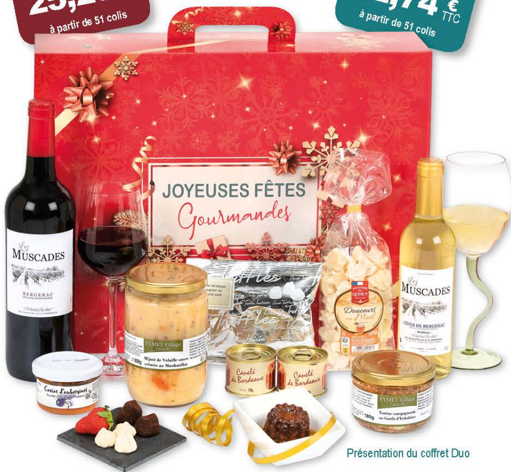
Présentation du coffret Duo