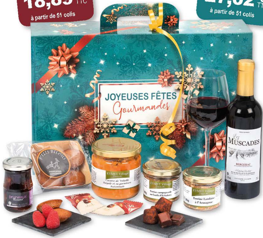
Présentation du coffret Solo

DUO Réf. COL 191 D 27,02 € TTC à partir de 51 colis